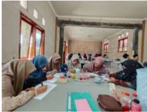
Gambar 1 Placement Test