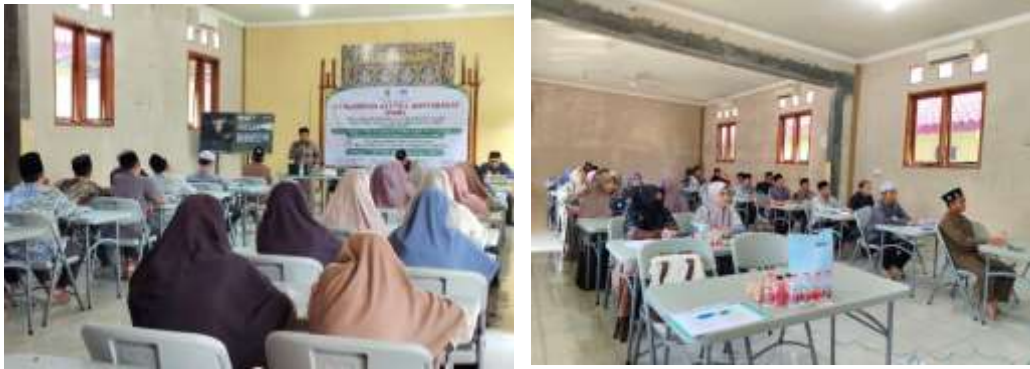
Gambar 4 Pelaksanaan Pelatihan Tadarus Al-Qur'an dengan Metode 5T