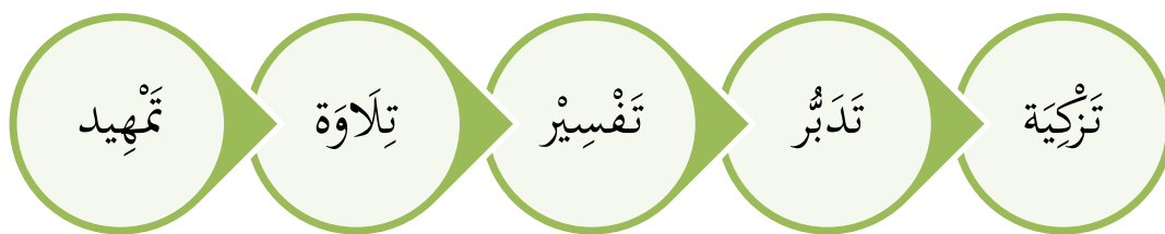
Gambar 3 Tahapan Metode 5T

Dilihat dari gambar di atas, maka dapat di tampilkan metode 5T: