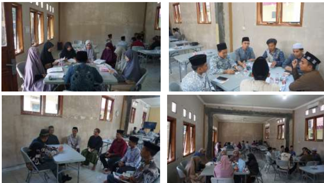
Gambar 5 Praktik Tadarus Al-Qur'an dengan Metode 5T Perkelompok

Kegiatan praktik ini berlangsung selama 30 menit, dan masing-masing kelompok pesertanya diberikan peran untuk mempraktikkan metode 5T tersebut. Lembar kendali fungsinya agar peserta bisa menuliskan apa yang telah dipahami dari ayat yang ditadarusi . Hal inilah yang menjadikan pelatihan ini semakin menarik dan menjadi metode baru sebagai musyrif /guru Qur'an dalam mengkaji ayat bersama santrinya.