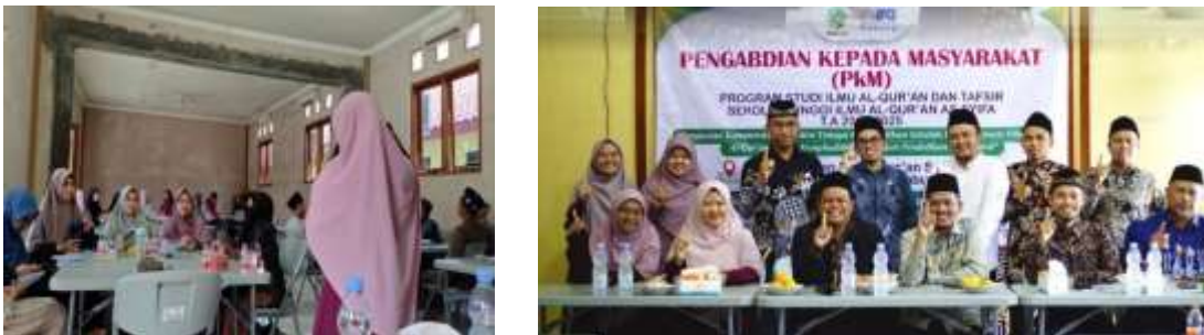
Gambar 6 Evaluasi Pelatihan Tadarus Al-Qur'an dengan Metode 5T

Secara keseluruhan, pelatihan ini dinilai efektif dan relevan dengan kebutuhan Ponpes Baitul Qur'an dalam membekali musyrif/guru Qur'an dengan keterampilan tadarus yang komprehensif. Program ini tidak hanya memperkuat aspek bacaan, tetapi juga memperluas wawasan para musyrif/guru Qur'an dalam membimbing santri untuk memahami dan mengamalkan Al-Qur'an ( tazkiyah ).