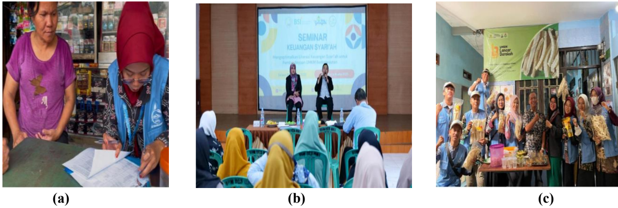
Gambar 1. Tahapan Eduksi Literasi Keuangan Syariah di Desa Gunung Putri, Kabupaten Bogor, Jawa Barat (a. Observasi awal, b. Seminar literasi keuangan syariah, c. Pendampingan lanjutan)

Para pelaku UMKM sangat antusias dalam mengikuti seminar literasi keuangan Syariah ini, para peserta yang hadir didominasi sebanyak 80% dari kalangan perempuan karena basis utama UMKM di Desa Gunung Putri adalah perempuan, sisanya 20% digerakkan oleh laki-laki. Para peserta seminar mendengar dengan seksama serta mencatat point-point penting yang disampaikan dalam seminar tersebut. Setelah paparan materi berakhir, kegiatan dilanjutkan dengan dialog interaktif antara pemateri seminar dan pelaku UMKM. Sesi ini menjadi bagian terpenting dalam memahami kendala riil di lapangan yang dirasakan oleh pelaku UMKM dan mendengarkan solusi dan masukan dari pemateri seminar.